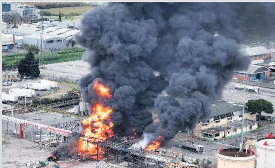
NUBE NERA La colonna di fumo che si è levata dal deposito di Calenzano dopo l'esplosione di ieri mattina

Fabrizio Boschi, Francesca Galici, Maria Sorbi e Patricia Tagliaferri alle pagine 6-7-8